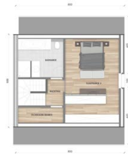
Grondplan zolder (optie)