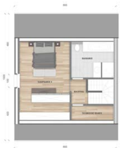
Grondplan zolder (optie)