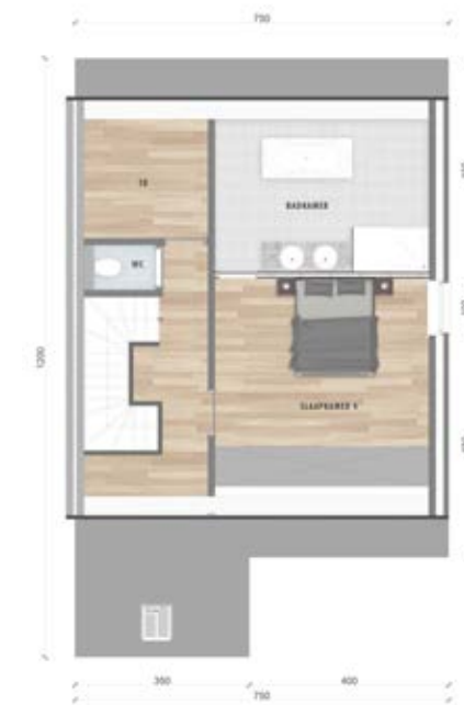
Grondplan zolder (optie)