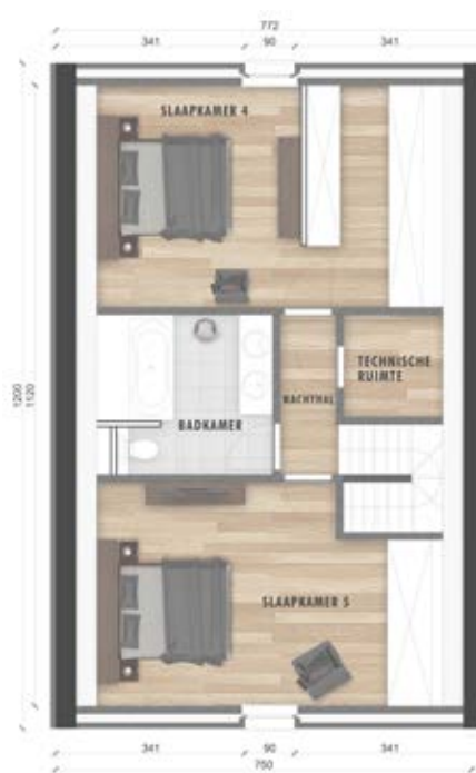
Grondplan zolder (optie)